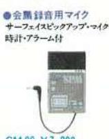
●会席録音用マイク サーフェイスピックアップマイク 時計・アラーム付 CM-90 ¥7,800