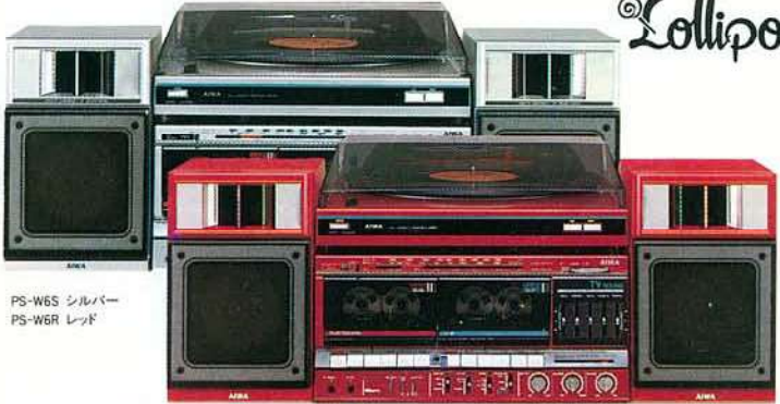
PS-W6S シルバー PS-W6R レッド

録 再オートリバー搭載のWカセット《ロリポップ》。TV(VHF)の 音声多重放送対応、TV/FM9局プリセットなど多彩な機能満載。