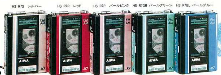
HS-R7S シルバー HS-R7R レッド HS-R7P パールピンク HS-R7GR パールグリーン HS-R7BL パールブルー