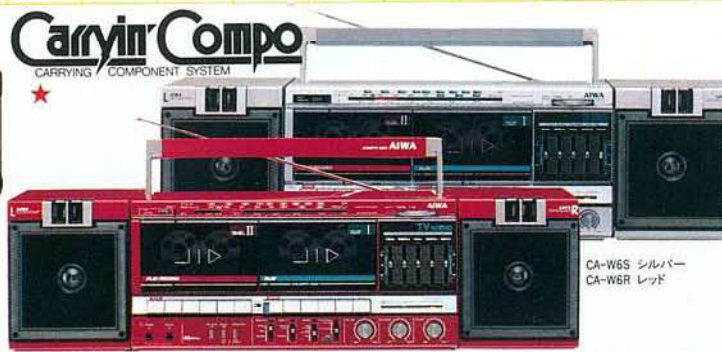
CA-W6S シルバー CA-W6R レッド

Carryin' Compo CARRYING COMPONENT SYSTEM