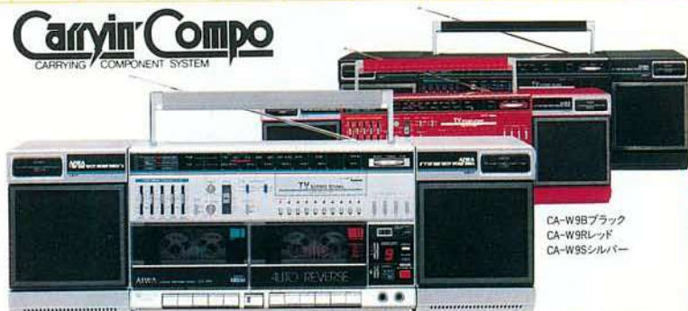
CA-W9B ブラック CA-W9R レッド CA-W9S シルバー

Carryin' Compo CARRYING COMPONENT SYSTEM