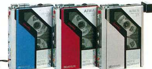
HS-F7BL パールブルー HS-F7R レッド HS-F7S シルバー