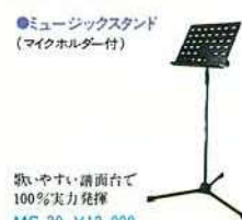
●ミュージックスタンド (マイクホルダー付) 歌いやすい譜面台で 100%実力発揮 MS-30 ¥12,000