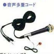
●音声多重コード 「プロの歌をカンニング」 音声多重コード MCW-2 ¥3,800 (マイクは、別売)