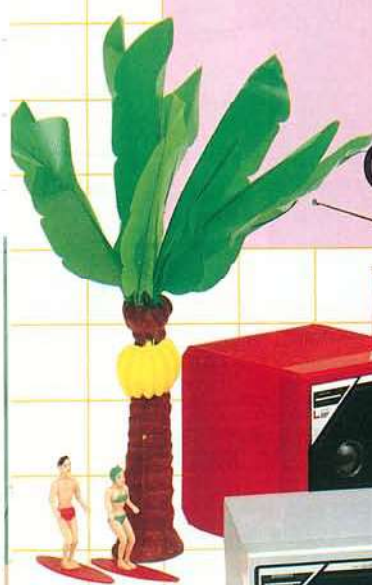
CA-W4S シルバー CA-W4R レッド

Carryin' Compo CARRYING COMPONENT SYSTEM