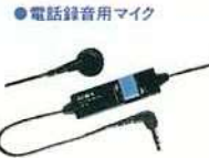
どんな電話の声も カンタンに録れる 「テレホンマイク」 CM-80 ¥2,700