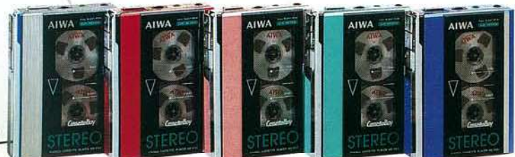
HS-P55S シルバー HS-P55R レッド HS-P55P パールピンク HS-P55GR パールグリーン HS-P55BL パールブルー

●トラック方式: コンパクトカセットステレオ方式 ●周波数範囲: 40~12,500Hz (NORMAL テープ), 40~16,000Hz (METALテープ) ●実用最大出力: 20mW + 20mW (EIAJ/DC) ●電池持続時間: 約3時間 (EIAJ出力1mW再生時), 約2.5時間 (EIAJ録音時) (付属 乾電池UM-4使用時) ●電源: DC-3V (単4乾電池×2), AC-100V (50/60Hz) (別売ACア ダプター使用) ●最大外形寸法: 幅83.3×高さ114.3×奥行24.7mm ●重量: 282g (電 池含む) ●付属品: ワンポイントステレオマイク、インナーイヤーステレオヘッドホン、 単4乾電池×2、ベルトハンガー、キャリングケース、ショルダーベルト