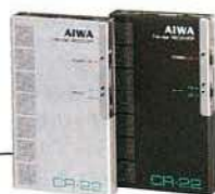
CR-22S シルバー CR-22B ブラック

●名刺サイズのイヤホン専用モノラルレシーバー●バンド切換えはFM/AMの2段切換え●海外でも使えるFMワイドバンド設計●ノワーセーブスイッチ回路●付属のイヤホンは、小型軽量インナー・イヤータイプのハイファイイヤホン●収納状態で操作できる手帳形ケース付属 ●受信周波数: FM76〜108MHz、AM530〜1,605kHz●実用最大出力: 20mW(EIAJ/DC)●電池持続時間: FM時約18時間(UM-4使用時)●電源: DC-3V(単4乾電池×2)●最大外形寸法: 幅56×高さ91.7×厚さ12.3mm●重量: 57g(電池含む)●付属品: ハイファイイヤホン、手帳形ケース、単4乾電池×2