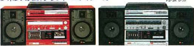
PS-3S シルバー PS-3R レッド

●受信周波数: FM76~108MHz, AM530~1,605kHz●トラック方式: コンパクトカセットステレオ方式●スピー カー口径: 150mm円型2個(ウーハー), 60mmコーン型ツイ ーター●周波数範囲: 50Hz~20,000Hz●電源: AC/DC/カー(センターユニット), AC(レコードプレーヤー)●実用最大出力: (AC時)7W+7W(EIAJ)