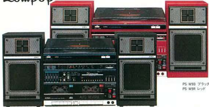
PS-W9B ブラック PS-W9R レッド