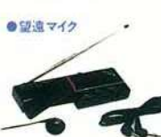
●望遠マイク 通常のマイクの 50倍以上(当社比) の超高感度 WM-Z5 ¥9,800