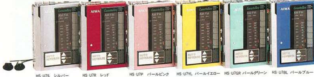
HS-U7S シルバー HS-U7R レッド HS-U7P パールピンク HS-U7YL パールイエロー HS-U7GR パールグリーン HS-U7BL パールブルー

ステレオトランスミッター機能搭載。もちろんオートリバー。FMステレオ/AMラジオ付ヘッドホンをプラスした音楽自由型のカセットボーイ。