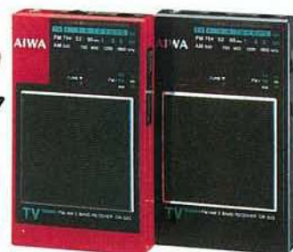
CR-S25R レッド CR-S25B ブラック

ラ イターサイズの超小型だから、胸ポケットにスッポリ。FM専用ステレオレシーバー《ステレオカードCR-3》。