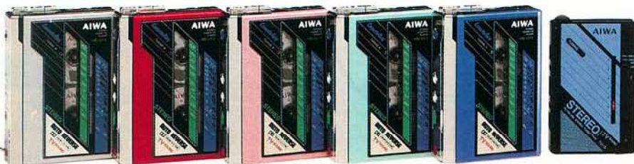
HS-U7VS シルバー HS-U7VR レッド HS-U7VP パールピンク HS-U7VGR パールグリーン HS-U7VBL パールブルー チューナーバック

●受信周波数:TV(1~3ch)FM76~108MHz、TV4~12ch、AM530~1,605kHz●トラック方式:コンパクトカセットステレオ方式●周波数範囲:40~12,500Hz(NORMALテープ)、40~16,000Hz(METALテープ)●実用最大出力:20mW+20mW(EIAJ/180)●電池持続時間:約3時間(EIAJ出力1mW時)テープ再生時約17時間(チューナーバック使用時)(付属乾電池UM-4使用時)●電源:DC-3V(単4乾電池×2)、AC-100V(50/60Hz)(別売ACアダプター使用)●最大外形寸法:幅81.8×高さ113.5×奥行25.6mm●重量:(本体)約265g(電池含む)(チューナーバック)60g●付属品:チューナーバック、キャリングケース、ショルダーベルト、ベルトハンガー、インナーイヤータイプステレオヘッドホン、単4乾電池×2